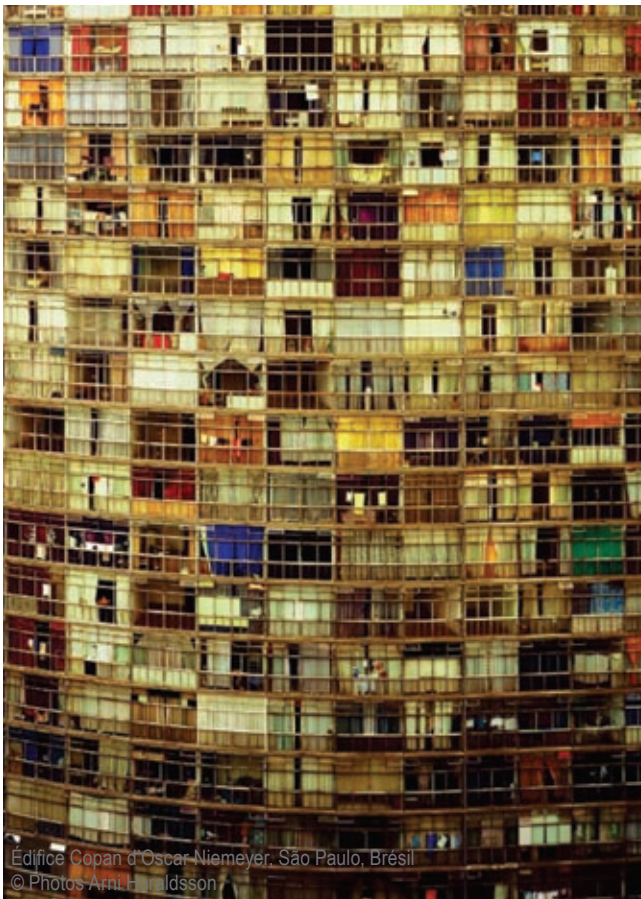
Edifice Copan d'Oscar Niemeyer, São Paulo, Brésil